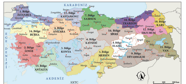
Karayolları Genel Müdürlüğü Hizmet Bölgeleri haritası